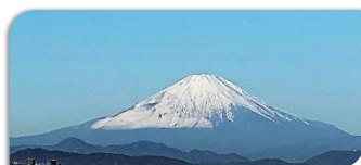
6階A研修室からの眺望