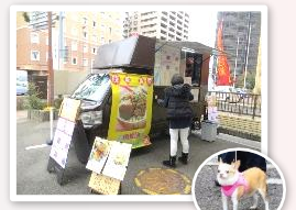
キッチンカー(台湾屋台飯)