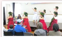
舞台発表(フラダンス)