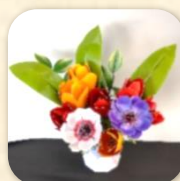
『チューリップ とアネモネ』