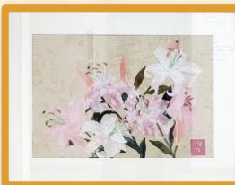
裂画『カサブランカ』(3階)