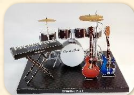
『楽器セット(ロック)』