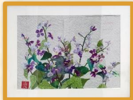
裂画『花だいこん』(4階)