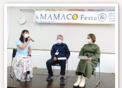
トークショーに出演する館長(Instagramライブ配信)