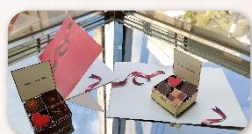
『ポップアップカード』